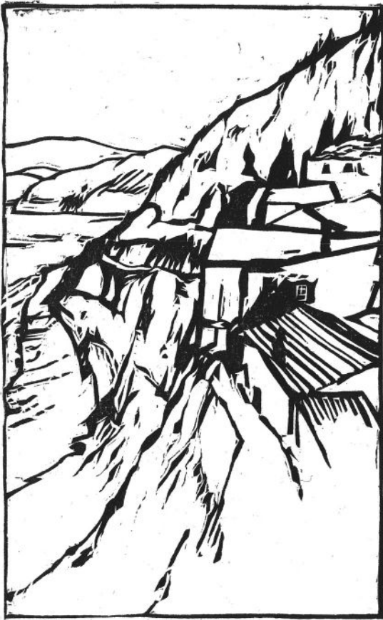
Nr. 108. – Holzschnitt von Christian Thanhäuser